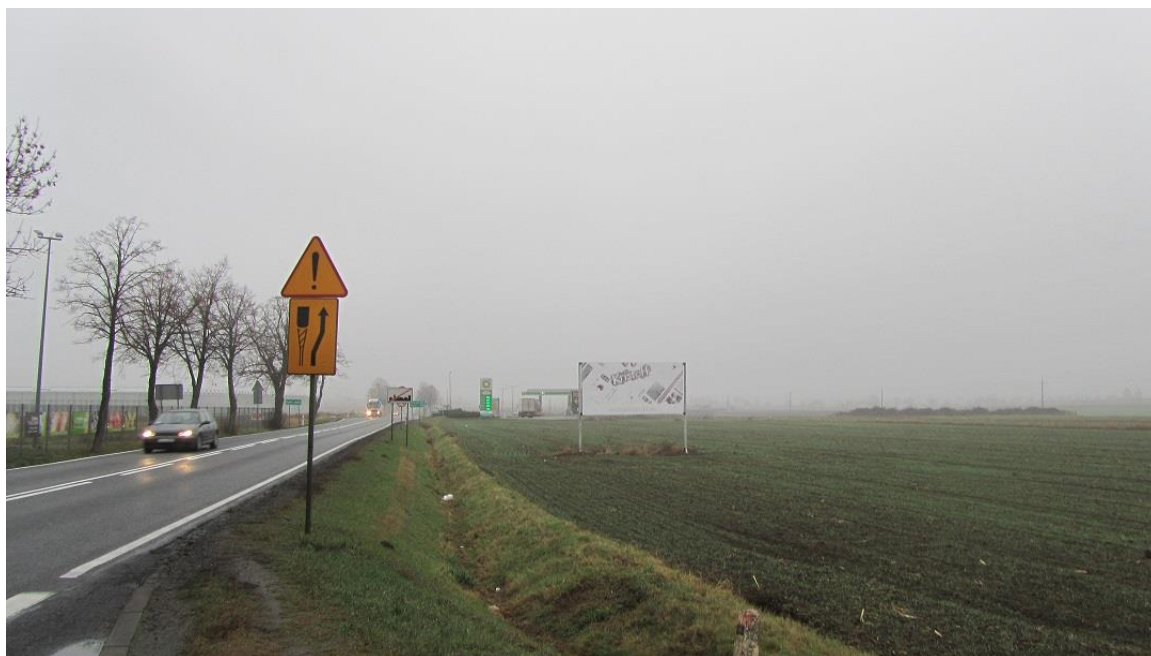
Fot. 2. Widok na teren planu. W głębi stacja paliw BP