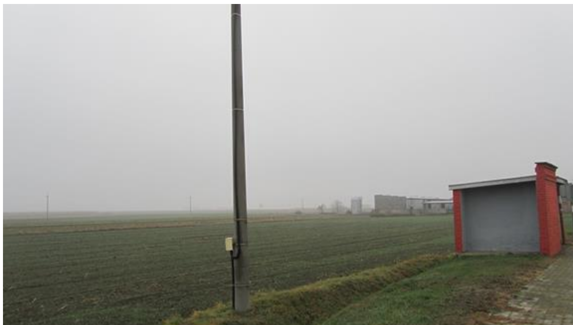
Fot. 1. Widok na południową część terenu planu. W głębi zabudowania zagrodowe