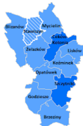
Mapka nr 1 i 2. Położenie gminy Stawiszyn na tle kraju, województwa i powiatu kaliskiego