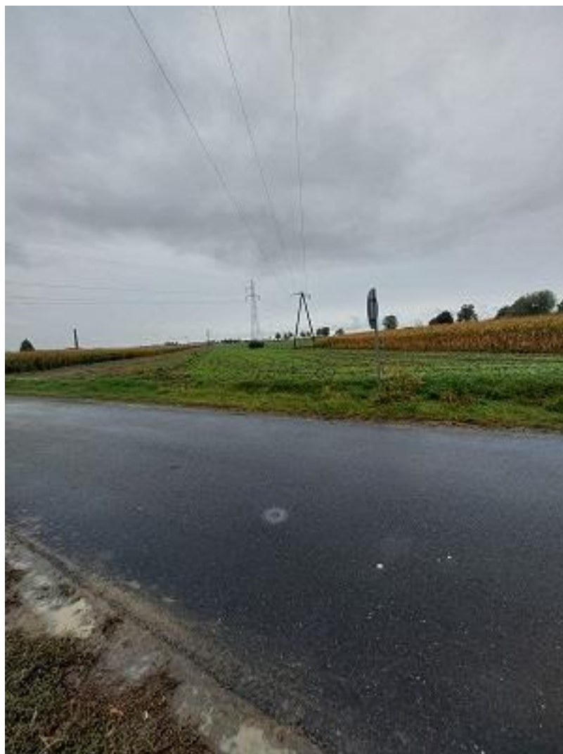
Fot. Widok na teren objęty planem w Wyrowie